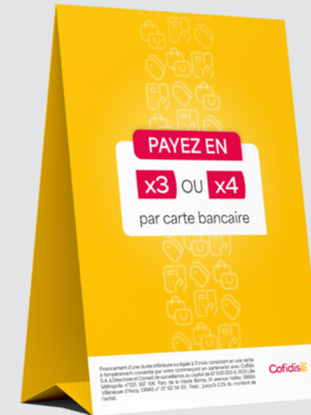
Chevalet sur le comptoir caisse