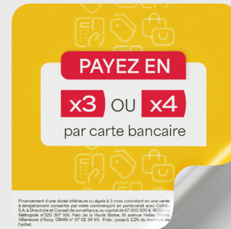
Sticker sur porte entrée du magasin