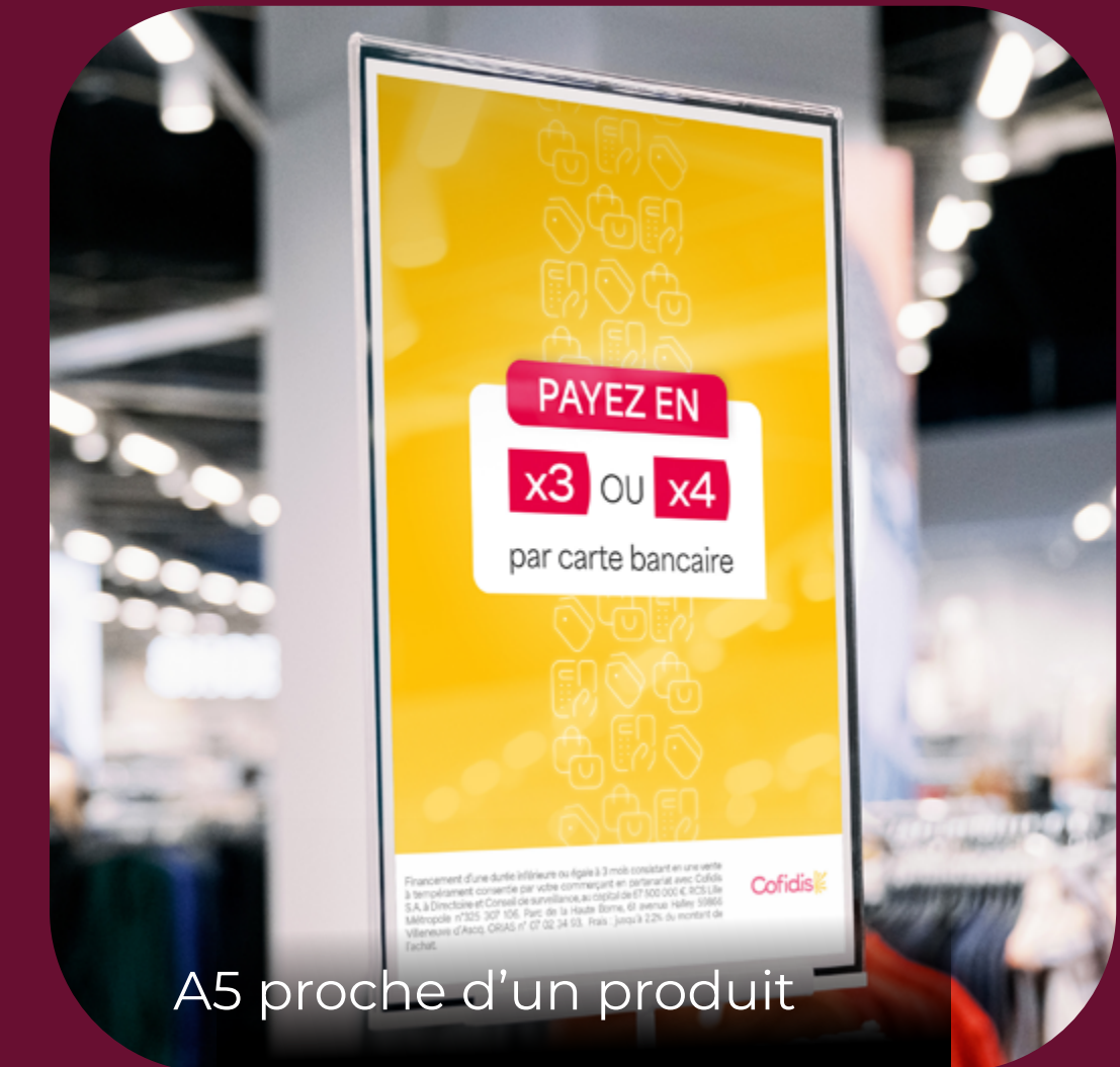
A5 proche d'un produit